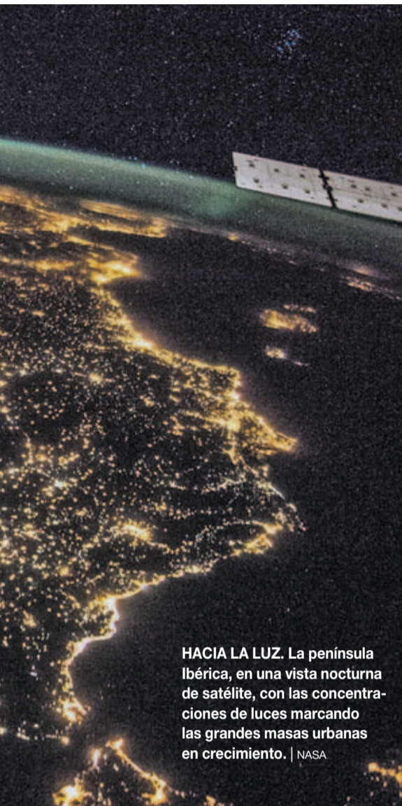
HACIA LA LUZ. La península Ibérica, en una vista nocturna de satélite, con las concentraciones de luces marcando las grandes masas urbanas en crecimiento.