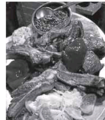
Carnes asturianas en Mesón Pascual.

Con una carta donde predominan los pescados y mariscos del Cantábrico, y las carnes asturianas, en el Mesón Sidrería Pascual es posible organizar nuestras celebraciones o cualquier evento con intimidad. Para ello, el local dispone de un comedor aparte, perfecto para todo tipo de reuniones alrededor de la mesa.