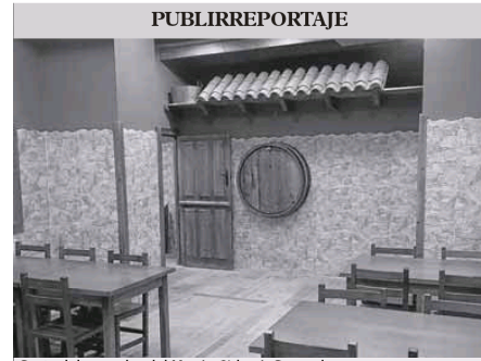
Parte del comedor del Mesón Sidrería Pascual.